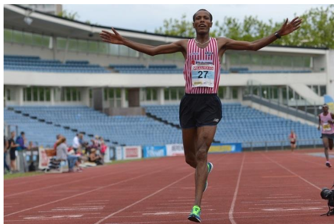
Svenska 5000m mästare